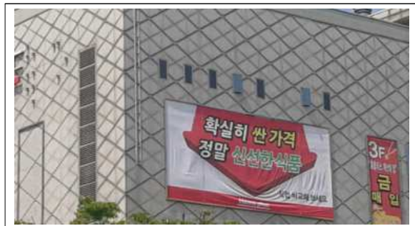
허가·신고된 게시시설에 부착